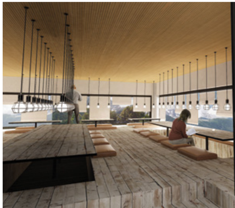
Sur ces images de synthèse (l'hôtel est en phase d'aménagement), on perçoit déjà l'importance des espaces communs: le lobby cinéma, la "banquise", l'îlot zen, les différentes zones d'attraction du réfectoire Esprit «collaboratif» es-tu là ?