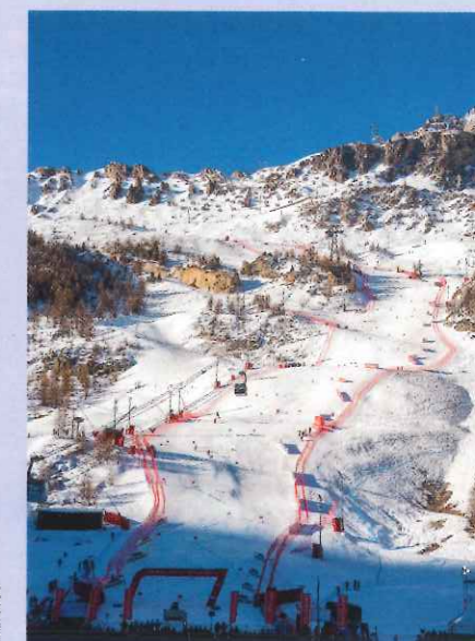
La Face de Bellevarde à Val d'Isère (Savoie).