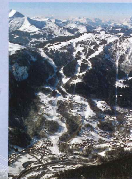
La Verte aux Houches (Haute-Savoie).

Voilà 70 ans que les skieurs les plus chevronnés arpentent la doyenne des pistes internationales. En février dernier, celle qui n'a de vert que le nom a accueilli deux spectaculaires épreuves