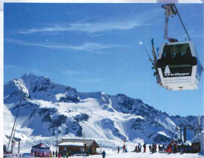
Le secteur glacier de Bellecôte en arrière-plan, Le Rochu à La Plagne (Savoie).