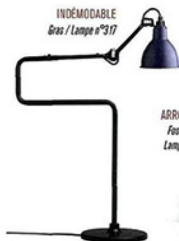
INDÉMODABLE Gras / Lampe n°317