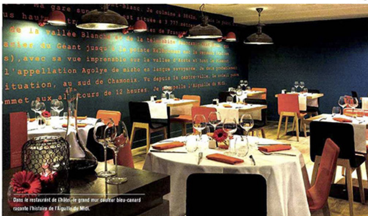
Dans le restaurant de l'hôtel, le grand mur couleur bleu-casard raconte l'histoire de l'Aiguille du Midi.