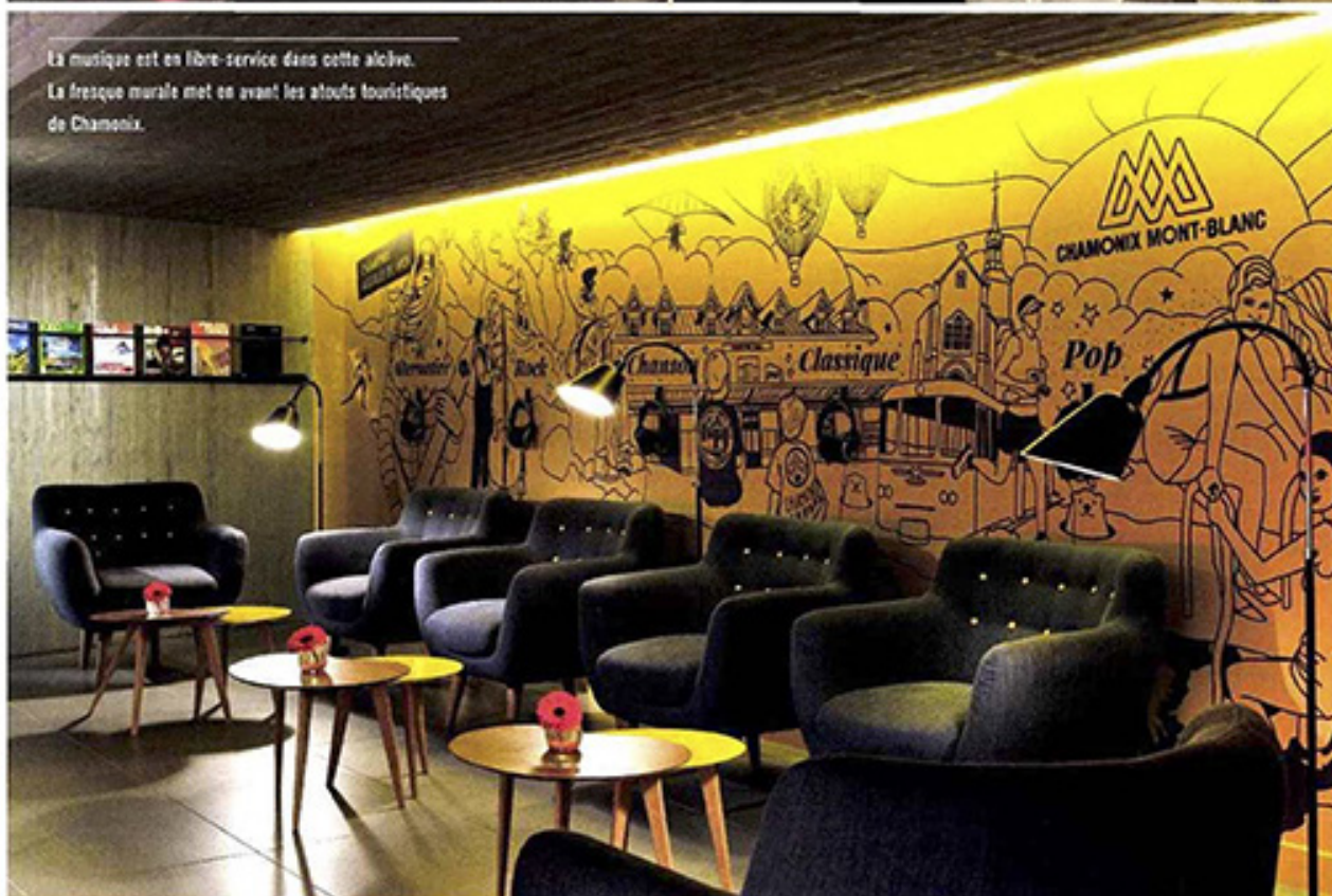
La musique est en libre-service dans cette alcôve. La fresque murale met en avant les atouts touristiques de Chamonix.