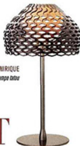
ONIRIQUE Fios / Lampe tuteur